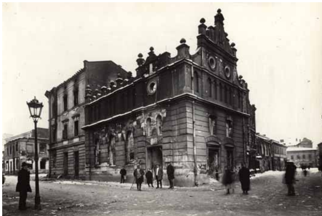
Фото 10: Хасидська синагога після погрому, Фотографія 1918 року