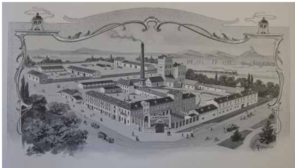
Фото 9: Фабрика “J.A. Baczewski”. Поштівка 1908-1914 років