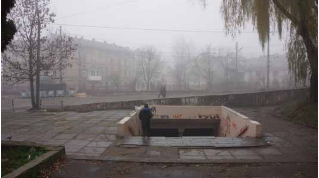
Фото 8: Підземний перехід через залізницю на вул. Б.Хмельницького