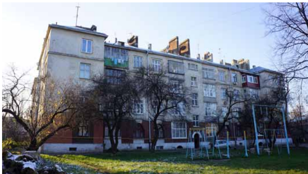
Фото 13: житловий комплекс, зведений для робітників трамвайного депо (вул. Промислова, 31-33) Джерело: Андрій Бондаренко

У міжвоєнному польському Львові особливих житлових проектів не затівали. Втім, декілька доволі комфортних будинків цього періоду у стилі функціоналізму на Підзамчі залишились. В радянський час, гасла “все для робітників” почали мінімально втілюватися в життя у житловій сфері лише на початку 1960-х років. На Підзамчі класичних мікрорайонів так і не збудували. Взагалі, всі містопланувальні трансформації соціалістичного періоду, які здійснювалися у Львові, найбільш пролетарського району дивним чином не захопили. Чи то львівські функціонери не хотіли збивати налагоджену роботу промисловості, чи просто дільниця виглядала настільки запущеною, що вирішили залишити усе як є до якихось кращих часів... Так чи інакше, район віддали на поталу помисловості, остаточно перетворивши його на сувору “промзону”. Є кілька показових прикладів перемоги фабрик над житловими будинками. Це, зокрема, високий цегляний паркан навколо будинків від трамвайного депо, про які вже згадувалося. Тамешні мешканці розповідають – після війни довкола їхньої домівки ще проглядалися зелені поля та пустирі. За кілька десятиліть побачити небо, а не похмурі заводські стіни можна було вже лише з верхніх поверхів.