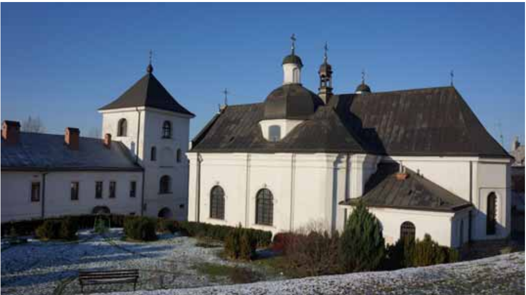
Фото 2: Василіанський монастир св. Онуфрія. Вид з монастирського саду

Доволі розбудовані квартали північної ділянки, яка отримала назву Краківського передмістя, почали приваблювати тих, хто прагнув міського життя, однак, з тих чи інших причин не міг стати офіційним львівським міщанином. Зі свого боку місто теж постійно намагалося витіснити туди усіх “недостойних”. Вже наприкінці 14 століття більшість приїжджих татар, караїмів і арабів починають селити “за мурами в ровах”, тобто у Краківському передмісті. В перших декадах 15 століття розпочався масовий наплив до Львова євреїв. Цей потік теж дбайливо відфільтровувався – усіх недостатньо багатих та впливових твердою рукою скеровували у північні квартали. Відповідно, найближчі до міста вулиці між Полтвою і Старим Ринком стали місцем передміського єврейського гетто. З часом його межі поширились на західний берег Полтви і далі на північ аж до села Замарстинова. Звісно ж, на території Краківського передмістя мешкали не лише євреї. Ділянка стала домом і для багатьох ремісників, які не мали достатньо ресурсів, аби вступити у львівські ремісничі цехи і, отже, не мали права працювати в місті. Близькість до міста у поєднанні з юридичною від нього незалежністю додали передмістю й іншу родзинку – кримінальну. Густозаселені, невпорядковані вулиці, на яких точилося жваве торгівельне і ремісниче життя були ідеальним місцем для різноманітних