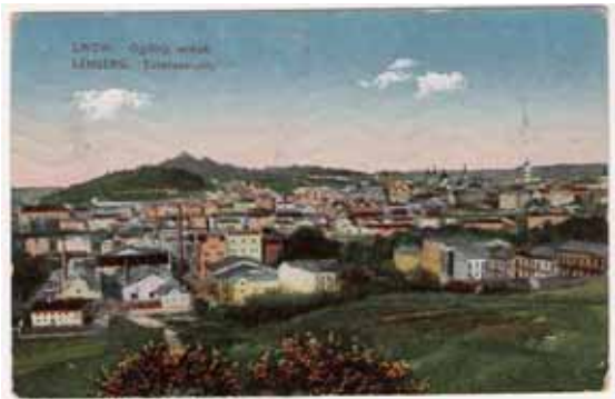
Фото 3: Вид північної частини Львова.

Через Львів мав пролягати шлях далі на схід – і у 1869 році цей шлях пройшов через те ж саме північне передмістя, яке відтоді розділилося надвоє. Проїзди під залізничними мостами стали воротами у таку собі “зону відчуження”. На півночі вона впиралася у село Замарстинів та русло Полтви, на сході – у село Знесіння. Між цими селами, втім, ще розташувався історичний район Габрієлівка – “сіра територія” обабіч Жовківської магістралі (сучасна вулиця Б. Хмельницького) та прилеглих доріг. Габрієлівка стала логічним продовженням Підзамче далі на околицю міста. Сьогодні це район вулиці Промислової.