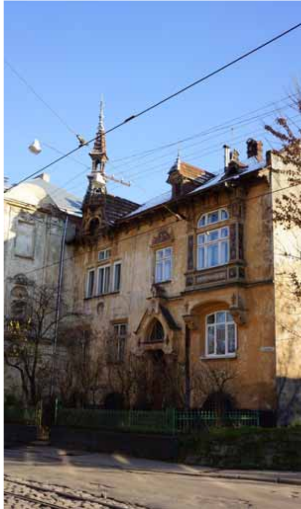
Фото 12: Кам'яниця Шульців (вул. Б.Хмельницького, 56)

Все ж таки поодинокі проєкти якісного житла для робітників були втілені і у Львові. Тут не було величезних індустріальних монстрів, які б могли збудувати цілі містечка для своїх працівників, як практикувалося у “великій Польщі”. Найкрупнішими підприємствами у Львові були залізниця та трамвайна компанія. У них працювало відносно багато людей (на залізниці – кілька тисяч), тому вони стали першими – і, на жаль, останніми будівниками зразкових робітничих помешкань. На Підзамче таким прикладом важливих соціальних трендів індустріальної епохи є житловий комплекс, зведений для робітників трамвайного депо на Габрієлівці у 1910 році. Хоча і початкові плани були набагато грандіозніші ніж будівництво двох гарних бу-