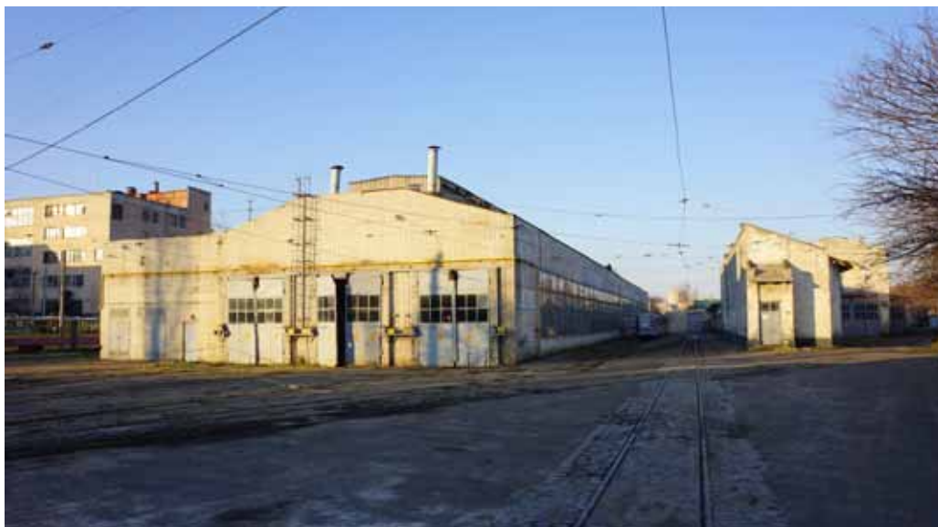
Фото 6: Будівлі трамвайного депо №2