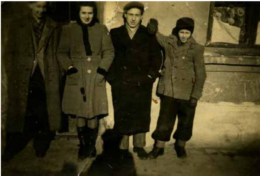
Фото 15: Мешканці ділянки Підзамче. Фотографія 1942 року

Дуже шкода, що сьогодні збереглося не так вже й багато свідчень про міську культуру довоєнного Підзамча. Найвідоміші мемуари колишніх польських мешканців мало згадують цей пролетарський закуток, надаючи перевагу описові glamourних центральних вулиць чи такого правдиво польського передмістя як Личаків. Єврейські мешканці могли б розказати більше. Однак, із зрозумілих причин їхні спогади стосуються більше трагічних подій Голокосту ніж культурних особливостей вуличного дозвілля.