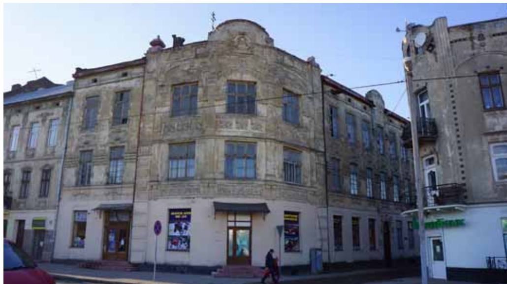
Фото 14: Кам’яниця Крампнера (вул. Б.Хмельницького, 169)

– меценатом, власником багатьох львівських кам’яниць і, зокрема, відомого театру “Колізей”. Гуртожиток фінансувався і з прибутку від винаймання помешкань, що теж розміщувалися у цьому будинку. Заможність власника проявилася у цікавому сецесійному оформленні фасаду – що не часто трапляється у практичному архітектурному середовищі Підзамча.