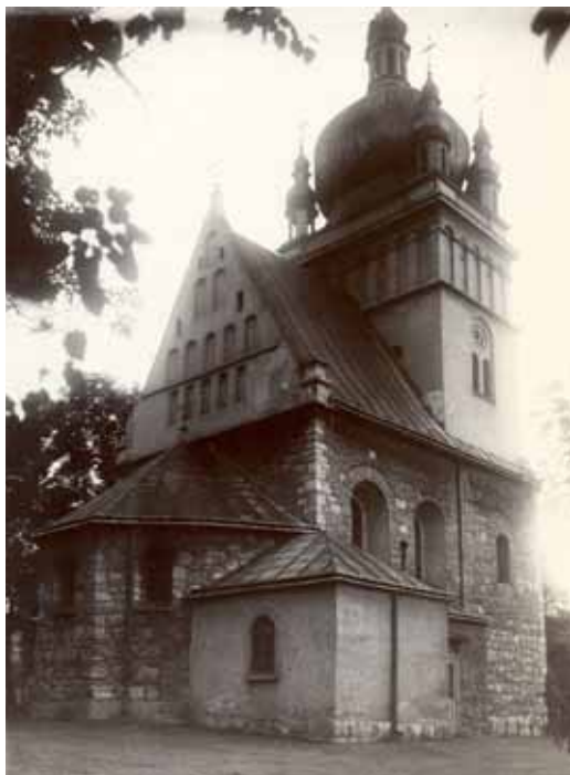
Фото 4: Церква св. Параскеви П'ятниці. Фотографія 1900-1914 роки

Церква святої Параскеви П'ятниці (вул. Б.Хмельницького, 77) – один з найстаріших храмів на Підзамчі і, взагалі, у Львові. Початок її побудови датують кінцем 13 – початком 14 століття. Основні форми церкви постали упродовж 14-15 віків, тому будівлю вважають прикладом місцевого романо-готичного стилю. Церква святої П'ятниці мала не лише релігійне значення. Це храм-твердиня, який виконував також оборонні функції, про що свідчать залишки стрільниць у її стінах. В межах княжого міста церква була найпівнічнішим бастионом львівського “підгороддя”.