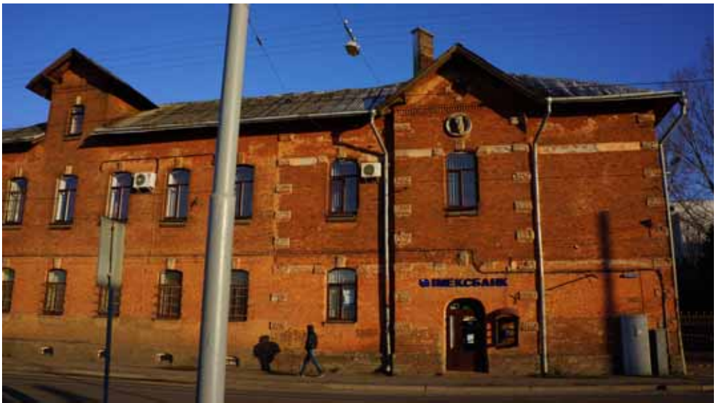
Фото 7: Будівля колишньої Нової різні

Важливим об’єктом у житті Підзамча і, взагалі, усього Львова була Нова Різня – місце, де різалося, продавалося та зберігалося м’ясо. Попередня міська Нова Різня довгий час розташовувалася на пустирі в районі перетину сучасного проспекту Чорновола та залізничної колії. У 1870-х роках її перенесли подальше на міські околиці – на кінець сучасної вулиці Промислової. Тоді постали два головних будинки. В одному розмістилася худоба, в іншому – адміністрація. На зламі 19-20 століть, в період бурхливого розвитку австрійського Львова, міська рада вирішила модернізувати різню. У 1901 році, зусиллями фірми І. Левинського, з’явився розбудований комплекс нової Нової Різні, що не поступався аналогам у інших крупних центрально-європейських містах.