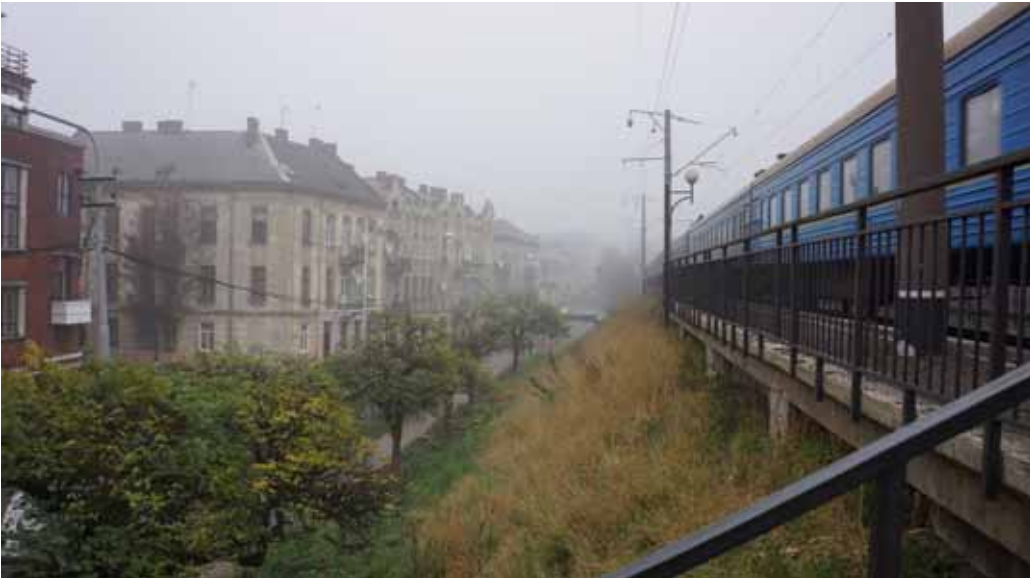
Фото 17: вулиця Кушевича

До Львова Грабінський приїхав у шкільному віці з містечка Кам’янка-Струмилова після смерті батька. У помешканні на вулиці Лобачевського письменник прожив разом з матір’ю майже усе своє коротке життя. У 1930-х роках Грабінський переїхав до Брюхович, в надії, що тамтешнє повітря допоможе йому вилікуватися від туберкульозу. Поховали Стефана Грабінського на Янівському цвинтарі у Львові.