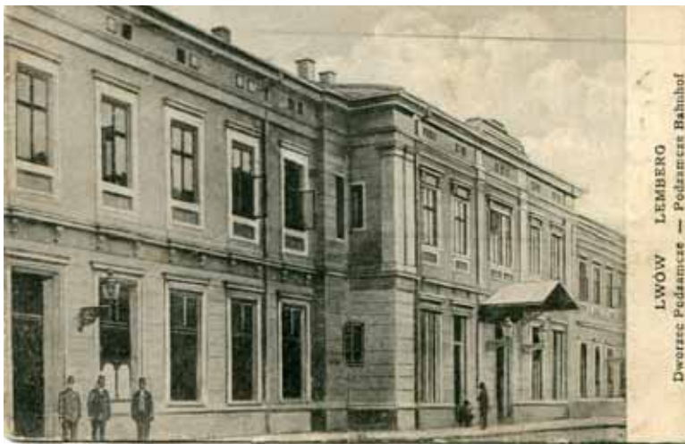
Фото 5: Вокзал станції “Підзамче”. Поштівка 1912 року