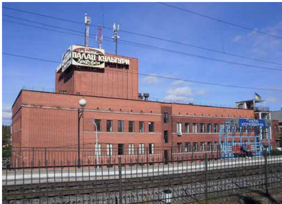
Фото 16: Палац культури ім. Гната Хоткевича

Дім працівників громади використовувався як для громадської активності, так і для дозвілля. Тут розташувалися великі зали для зібрань, менші – для засідань, лекцій, музичних гуртків, також діяли буфет, кегельбан, пральня, бібліотека. Будинок навіть отримав неофіційну назву “червона фортеця”, яка обігрувала червону цегляну облицювку стін та соціалістичні настрої відвідувачів.